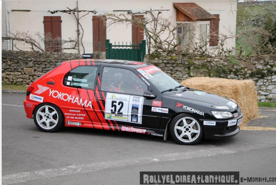
RALLYE LOIRE ATLANTIQUE. E-MONSITE.COM